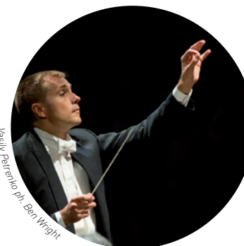
Vasily Petrenko