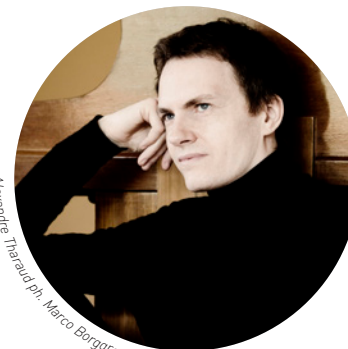
Alexandre Tharaud