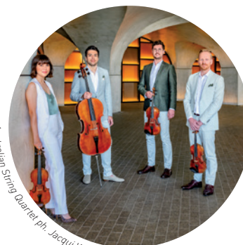
Australian String Quartet