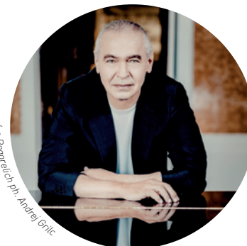
Ivo Pogorelich