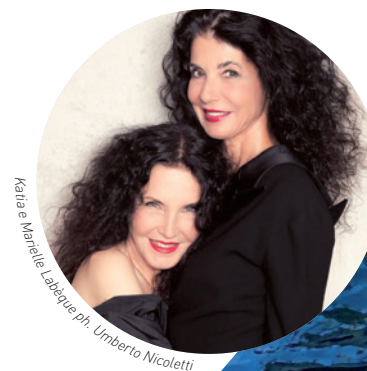
Katia e Marielle Labèque