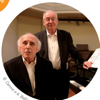
B. Canino e A. Ballista