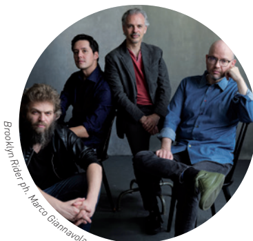
Brooklyn Rider