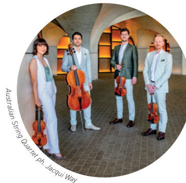
Australian String Quartet