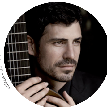
Pablo Sáinz Villegas