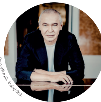
Ivo Pogorelich

Carnet Oro Pass Posto unico numerato € 15