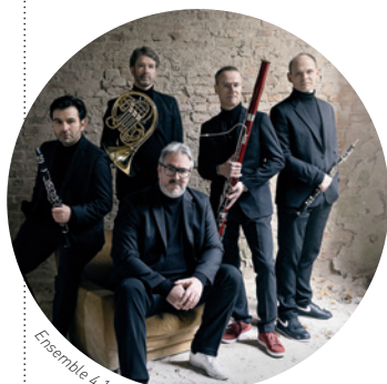
Ensemble 4.1

Auditorium Giovanni Agnelli - Lingotto ore 20