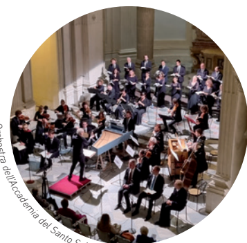
Orchestra dell'Accademia del Santo Spirito