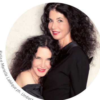
Katia e Marielle Labèque